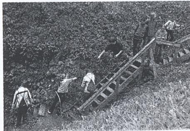
Biržiečiai mokiniai padėjo speleologams išvalyti Karvės olą.