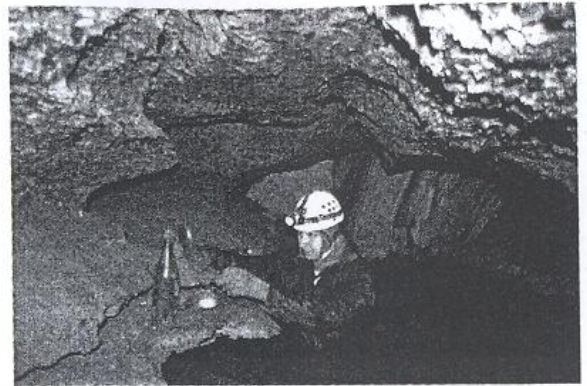
Taip atrodo Karvės ola iš vidaus.