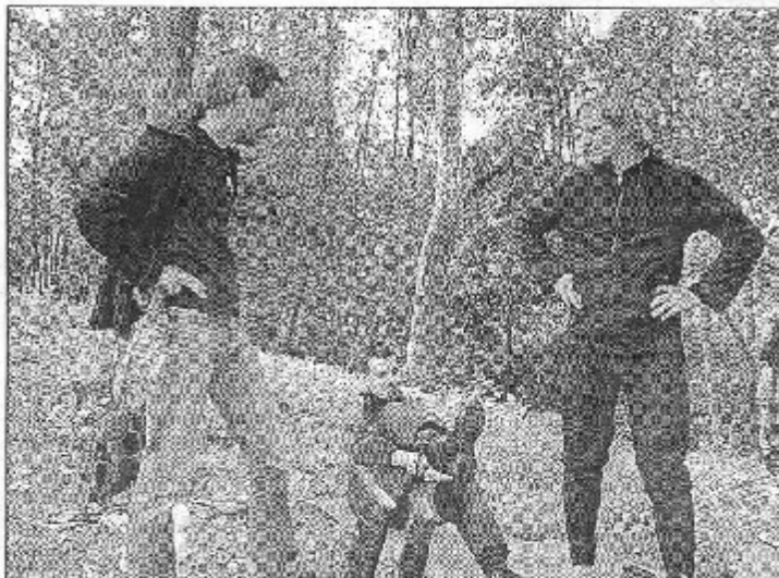
Žygiui į urvą besiruošiantys speleologai avėsi vilnones kojines, o po nepershilpamais kostiumais rengėsi šiltus drabužius.