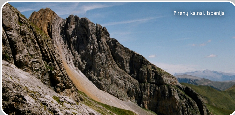
Pirėnų kalnai. Ispanija