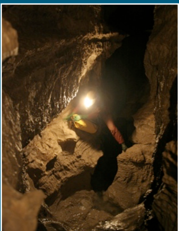
Abchazija. Vakarų Kaukazas. Iljuchino urvų sistemos tyrimai