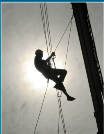
Varžybos „Aukštuminių Statybų Tech- nologijų“ taurei laimėti. Panevėžys