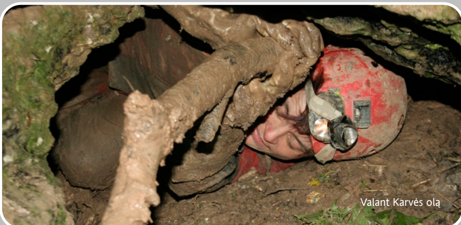
Valant Karvės olą

Prie Karvės olos dažnai švenčiamos vestuvės, gimtadieniai, iškylos. Nors šį urvą prižiūrinti Biržų regioninio parko administracija yra įrengusi ne vieną šiukšliadėžę, tačiau atvažiauvusiems iškylautojams knieti išbandyti urvo gylį mėtant pagalius, butelius ar kitus daiktus. Speleoklubo „Aenigma“ taryba ir Biržų regioninio parko administracija sutarė ir toliau bendradarbiauti tvarkant ir valant Šiaurės Lietuvos karstinius darinius ir įgriuvus.