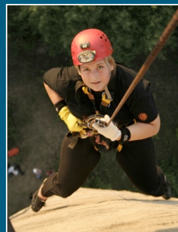
Speleologų mokyklos treniruotės ant 47 m. aukščio vandentiekio bokšto