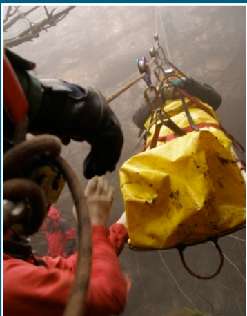
Speleo gelbėtojų kursai. Pietų Ukraina. Krymo pusiasalis